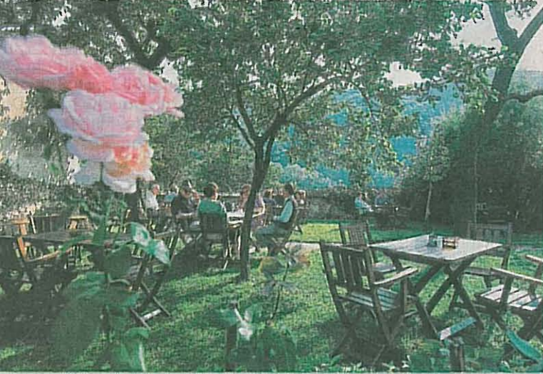
Romantisch: der Heurigengarten des Prandtauerhofs